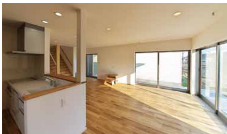
テラスに面したLDKの一角の窓をL型にして、引き込み窓にすることで、テラスとLDKの間に障害物がなくなり、外と内が融合した空間が出来上がります。また、そこにハンモックを吊るして、光と風を感じながら、気持ちよく転寝をしたり、カフェ気分を味わうことができます。