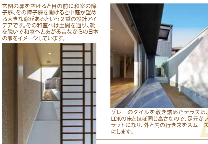
玄関の扉を開けると目の前に和室の障子扉、その障子扉を開けると中庭が望める大きな窓があるという2重の設計アイデアです。その和室へは土間を通り、靴を脱いで和室へとあがる昔ながらの日本の家をイメージしています。