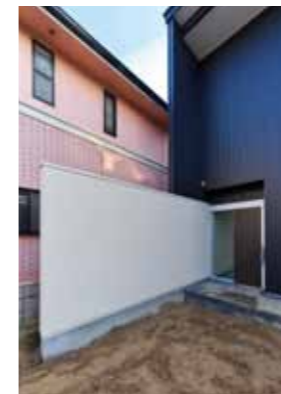
玄関ポーチ~土間~和室~庭へと続く白壁は、家の象徴となるアクセントであり、外と内を融合させる役割もあります。

旦那様の仕事部屋。壁2面にある作りつけの作業机と収納棚。また、仕事の合間には、中庭に面した窓から日本庭園を眺めてホッと息できたりも。